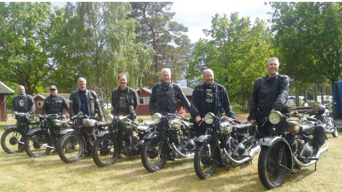
Årets uppställning med BSA Slopers, BSA Weekend, Öland 2016.

Om vi räknar att BSA Sloper introducerades i och med 1927 års modell så är det 90 år sedan modellen introducerades. Modellen presenterades i augusti 1926 för världen och kom som en bomb på den Engelska MC marknaden. Modellen är skiljelinjen mellan den antika motorcykeln och den "moderna" motorcykeln genom sin design och utförande.